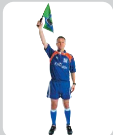
Успешный удар по воротам