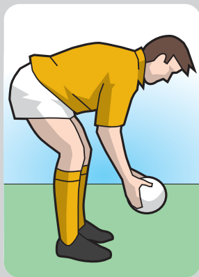
Введение мяча в схватку