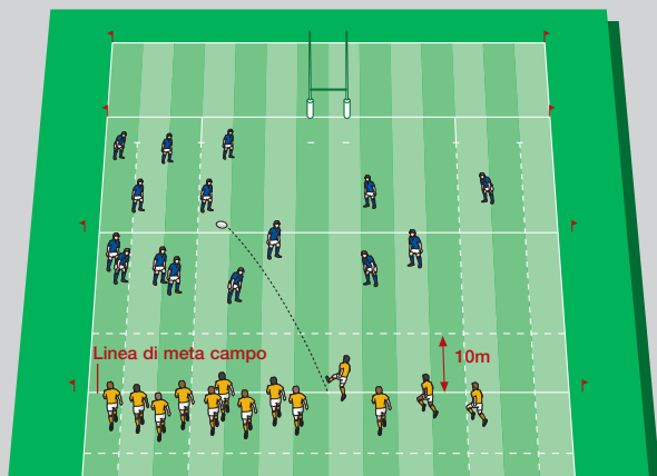
Calcio di invio

Tutti i giocatori della squadra avversaria devono posizionarsi su o dietro la linea dei 10-metri. Se sono davanti a questa linea oppure se caricano prima che il pallone sia calciato, il calcio sarà ripetuto.