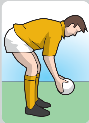
Introduction en mêlée