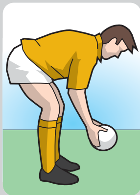
Introduction en mêlée